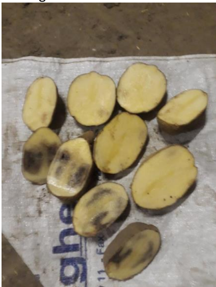
Zwart-roest-verkleuringen bij Challenger

Er worden ook problemen gemeld met Challenger. Deze vertonen dit seizoen gemakkelijk roest en zwarte plekken. Vele loten worden afgekeurd. Een fenomeen dat eigen is aan Challenger en waarmee sterk opgelet moet worden bij lichte en boor-arme gronden. Dit werpt toch een grote vraag op naar al die nieuwe rassen die pootgoedverkopers aan de boeren voorstellen. Velen hebben gebreken die pas later blijken of bij uitzonderlijke weersomstandigheden zoals droogte naar boven komen. Als er een probleem opduikt bij de opkomst of later met de kwaliteit (laag onderwatergewicht, plekken enz.) is de boer steeds de pineut. Wie draagt de verantwoordelijkheid? Moeten we ons niet beter inlichten? Voor wat betreft Challenger moeten we ons ook de vraag stellen of dit ras wel een ras is waarop we kunnen voortbouwen? Zeer twijfelachtig in elk geval op lichte gronden.